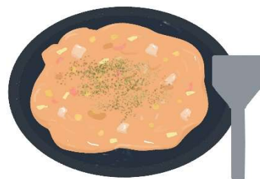
伊勢崎もんじ焼き